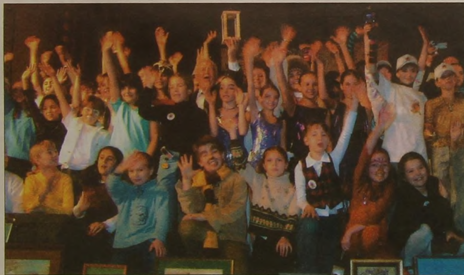
Вот они, участники фестиваля!

К 90-летию латвийской писательницы Маргариты Старасте